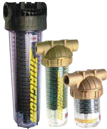
クリア20" クリア10" クリア5"

システムや機器の寿命を縮める液に含まれるコンタミ(錆び・鉄粉等)を除去し、常に清浄な液体を循環させ、加工精度・品質・機能が向上し、トラブルをなくします。